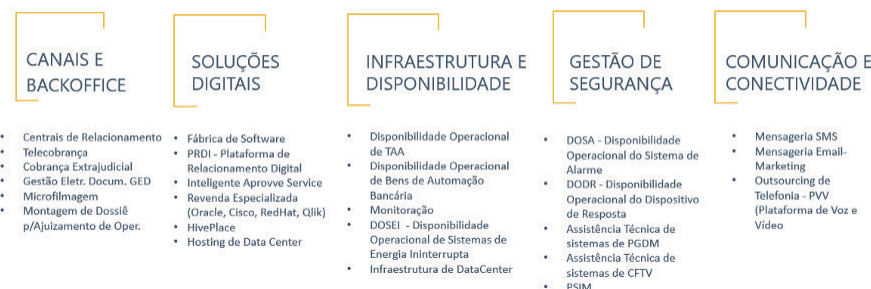
Imagem 3. Linhas de negócios e produtos do portfólio BBTS

O portfólio da BB Tecnologia e Serviços se mostra bastante amplo e diverso. A gestão desse portfólio considera a sinergia entre produtos e serviços e está organizada de forma a garantir os melhores resultados operacionais, bem como melhor eficiência na estruturação de novos negócios: